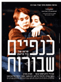
אבגדיה (פונט מאת עודד עזר, הפוסטר בעיצוב מיכל סהר)

אבגדהוזחטיכלמנס עפצקרשת קסןףץ ? <!> 1234567890 {(;-;,"-$/מ='+##%*)